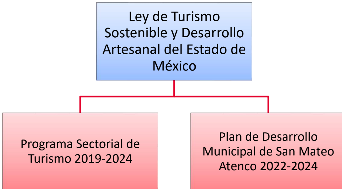
Gráfico 3. Principales instrumentos que fundamentan al Programa a nivel Estatal y Municipal.